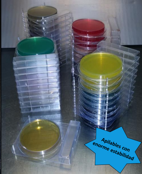
Apilables con enorme estabilidad