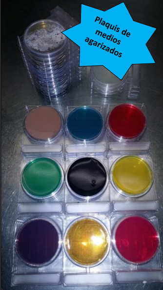
Plaquitas de medios agarizados