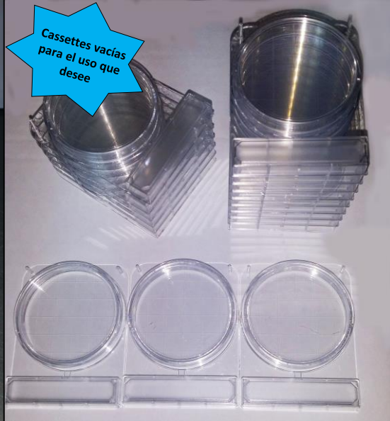
Cassettes vacías para el uso que desee