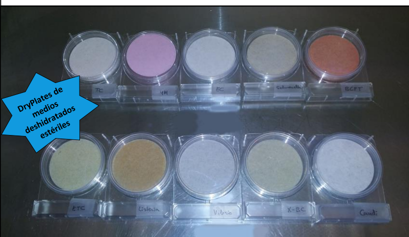
DryPlates de medios deshidratados estériles

Tecnología de transporte, almacenamiento y visualización de muestras microbiológicas