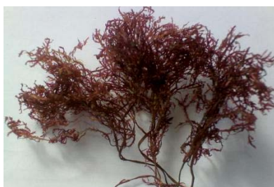
Izda: Gelidium

Documento elaborado el 10 de Mayo de 2013