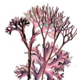
Dcha: Chondrus (Dibujo Koehler)