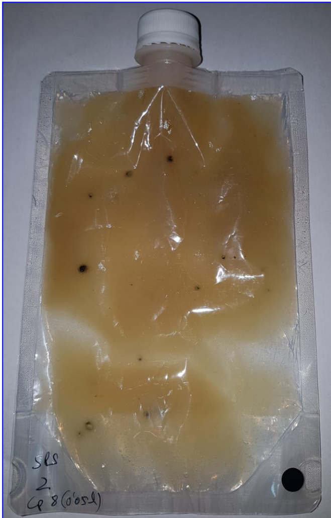
Quanti-P/A CSR incubado 18h: Colonias negras, redondas y puntiformes.