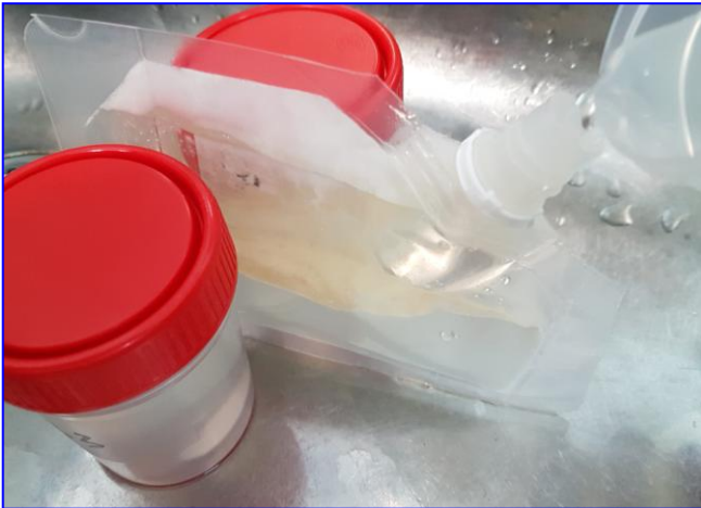
1-Dispensar la muestra dentro de la bolsa, por el tapón

Vea también el video del modo de empleo: https://www.youtube.com/watch?v=A8WifR8mZ1k