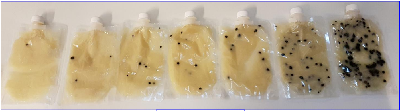
Linealidad en QPA-CP