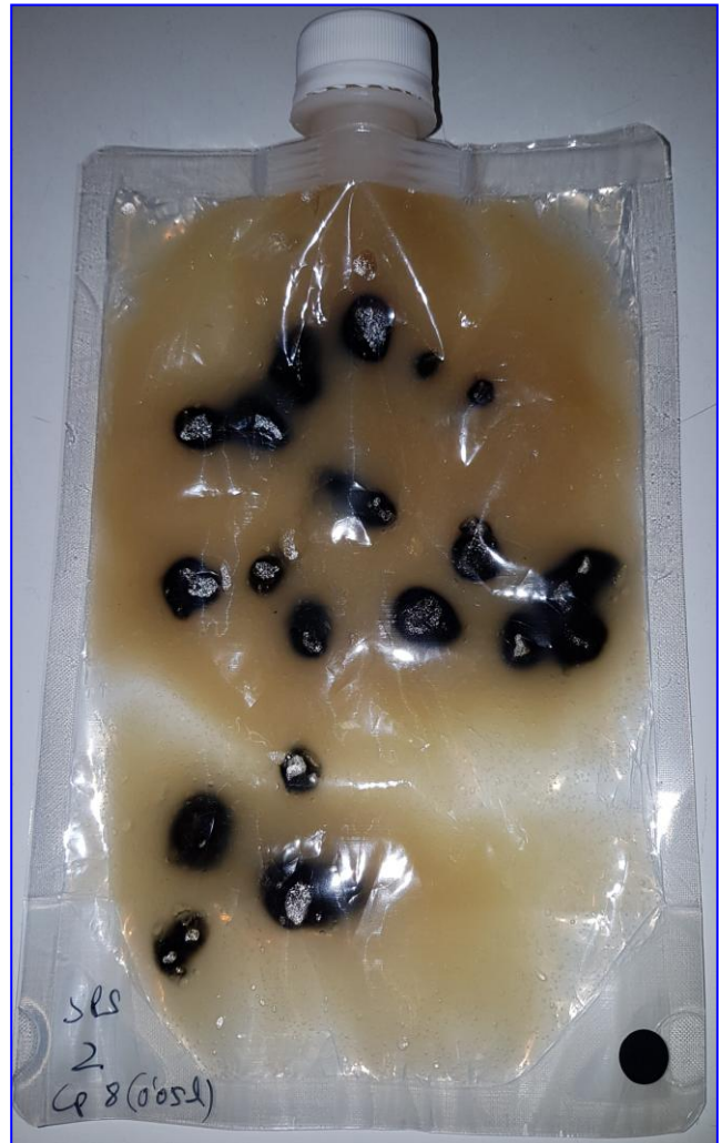
El mismo, incubado 48h: Colonias negras, redondeadas, grandes y con gas en su centro. Esto las distingue de posibles artefactos del citrato férrico, ya que éstos son pequeños, de contorno irregular y no crecen. Espectacular recuperación (22 colonias, cuando en SPS clásico incubado en jarra de anaerobiosis, sólo se detectan 8 –valor inóculo–)

Abajo: 3 fases de la disolución de un artefacto negro, después convertido, mediante amasado con pellizcos, en una nube azul oscuro, y luego bien disuelto, sin residuos.