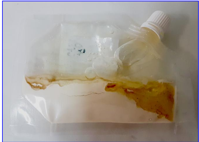
2-Aspecto de la muestra sin mezclar aún con el medio