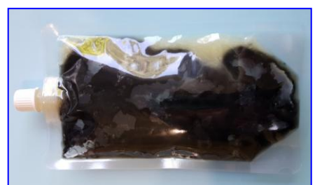
5-Tras la incubación, Recuentos bajos, medios e incontables (macrocolonia negra por confluencia de muchas colonias)