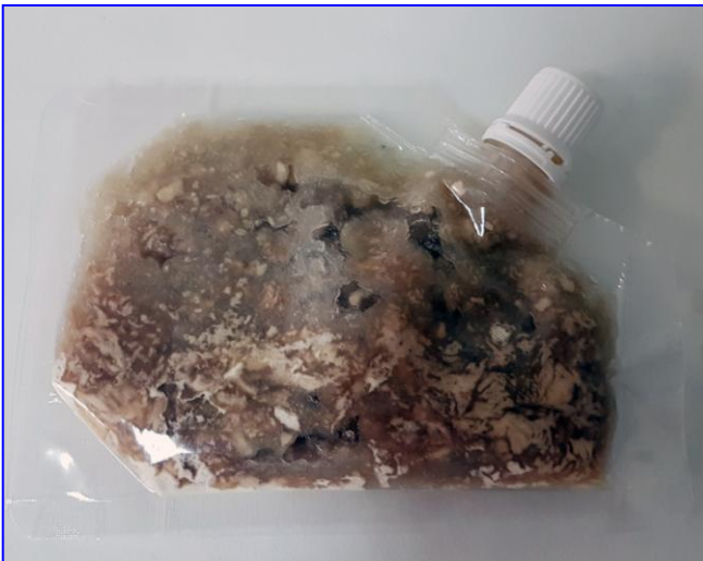
3-Mezcla suficiente tras amasar 30 segundos, a pesar del aspecto heterogéneo, que desaparecerá al incubar