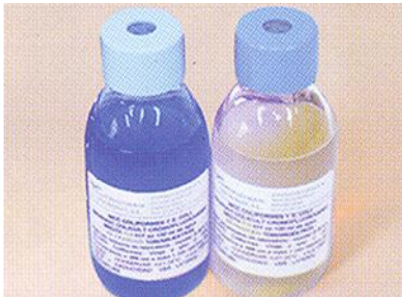
Frascos P/A con MCC: Izquierda positivo, Derecha Negativo

El usuario final es el único responsable de eliminar los microorganismos de acuerdo con la legislación medioambiental vigente. Autoclavar antes de desechar a la basura.