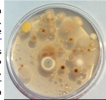
Placas LPT Agar y Rosa Bengala Agar con floras mixtas