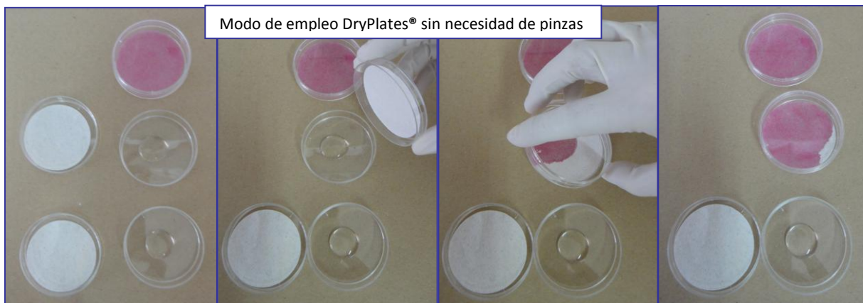
Modo de empleo DryPlates® sin necesidad de pinzas

Si se prefiere, puede tomar el disco nutriente con unas pinzas y colocarlo directamente sobre el ml de muestra, previamente dispensado en el centro de la placa):