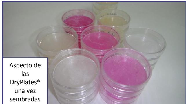
Aspecto de las DryPlates® una vez sembradas

Las DryPlates® son placas preparadas, estériles y listas para su uso inmediato, con 2 años de caducidad desde fabricación, al estar elaboradas con medio deshidratado, que se hidrata precisamente mediante la muestra en el momento de inocularla. La gelificación en frío (a diferencia del clásico medio con Agar-agar, que precisa hervir para gelificar) se consigue con un desarrollo de MICROKIT denominado "Hidragar", que ahorra el hervido-fusión-enfriado-a-45°C y las 2 horas de todo este trabajo propio del medio clásico. El reparto inmediato de la muestra y la distribución homogénea del medio se consiguen gracias al Disco Nutriente , un disco fibroso de malla muy fina que retiene juntos el medio de cultivo en polvo y la muestra.